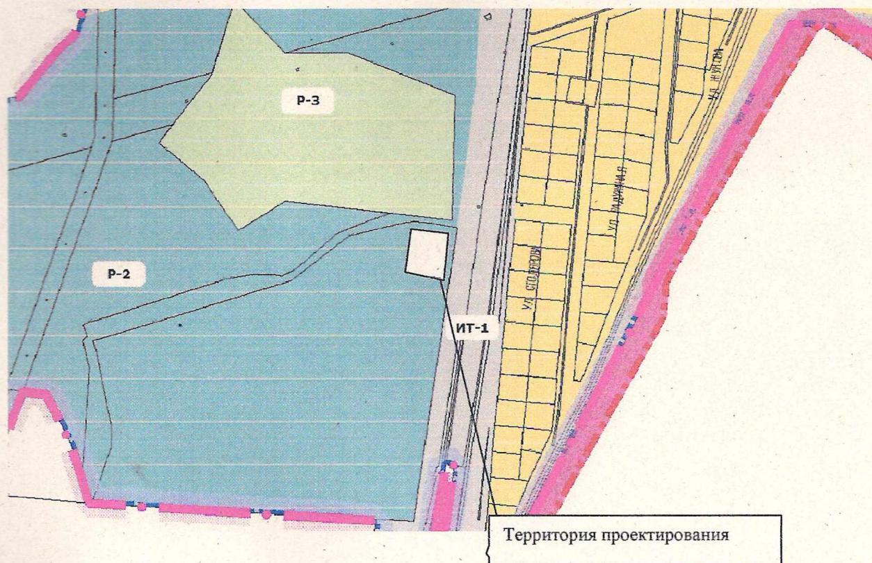
Схема охранных зон на территории проектирования